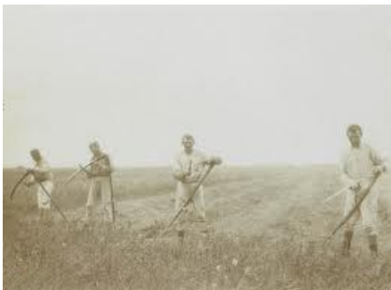
't Mèije mi de zèisie.