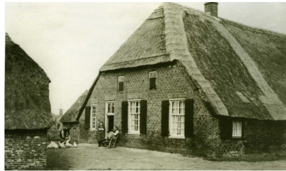
Op d'n Eikenheuvel.

Dúzend gulde, die beurde eigenlijk noit èn dan zomar in oew tes! Dor gaode toch nie mi rondslèipe. "Mâg ik ut ók efkes goed zien?", zin Driek, "want ik heb er nog noit gin gezien. Zò ik ut ók efkes vâst mâge haauwe, dan kan ik ók zegge dèk oit un briefke van dúzend in m'n hând heb gehad."