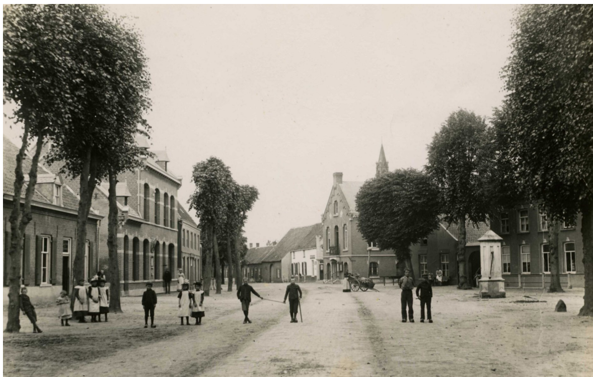
De Marktstraat rond 1905 met links het nieuwe postkantoor waar voorheen café Bellevue stond. Rechts een stukje van Stoomboekdrukkerij Van der Heijden & Van Dijk.