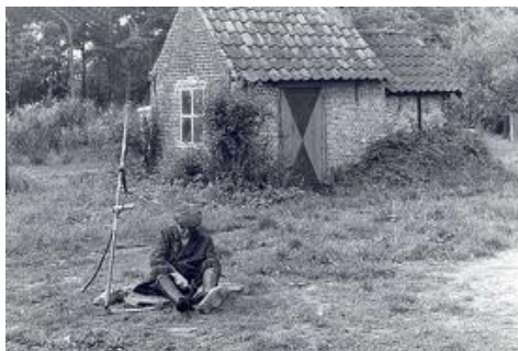
‘t Scherpen van de zeis.