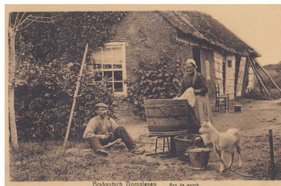
“Aan de wasch.” Ansichtkaart uit een serie Brabantsch Dorpsleven in het midden van de twintigste eeuw.

Vanuit ‘t mesieen ging de was in d’n úrste teil um te spuule. D’rnoo d’n twedde èn d’n derde mi ‘t blauwsel. Zoo, nou óp de skrâg dan kós ‘t goed uitdrûppe.