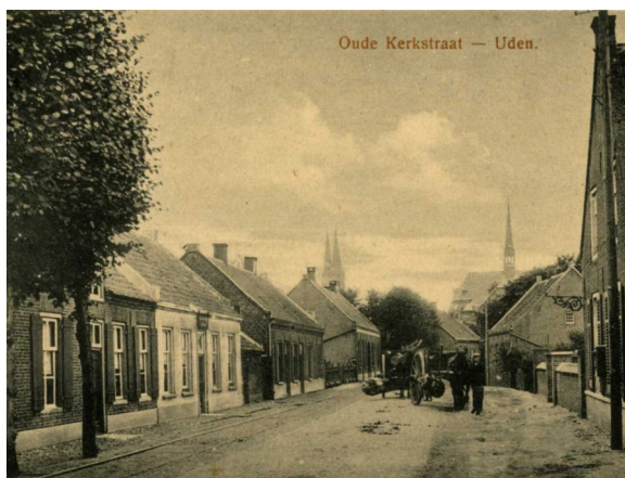
Prentbriefkaart uit 1915 van de "Oude Kerkstraat" ofwel de Kapelstraat.

Hij ging wonen aan de Kapelstraat in een huis waar later de kleuterschool van de zusters Franciscanessen zou komen.