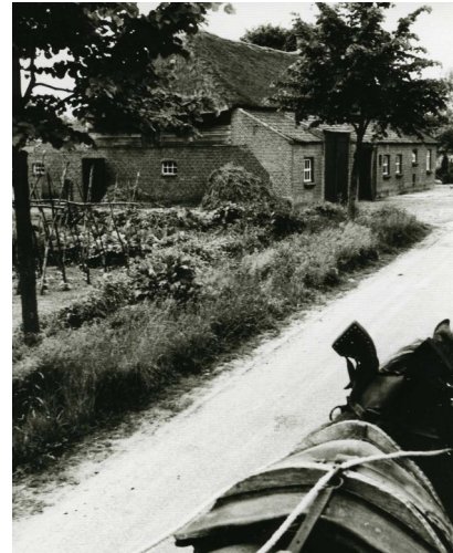
Op de Eikenheuvel..

Duizend gulden, die kreeg je bijna nooit. En dan zomaar in je broekzak! Daar sleep je toch niet zomaar mee rond? "Mag ik het eens goed zien", zei Driek, "want ik heb er nog nooit een gezien. Zou ik het ook vast mogen houden, dan kan ik zeggen dat ik ooit een briefje van duizend in mijn handen heb gehad."