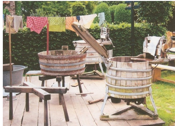
Oude wastobbes en andere nostalgische attributen uit de periode van vóór de wasmachine.

Vanuit de machine ging de was in de eerste teil om te spoelen. Daarna de tweede en de derde met het blauwswel. Zo, nu op de schraag dan kon het goed uitdruppen.