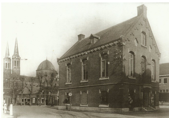
Het raadhuis op de hoek van de Kerkstraat, gezien vanuit de Sint Janstraat met rechts het bordes waar "d'n bok van Kitteke" op heeft gestaan.

nieuwe raadsfunctionaris bedenkelijke bewegingen te maken zodat de drager van de edelachtbare last bevuiling begon te vrezen. Daarom klom hij weer naar beneden. De versierde bok met aangehechte sierraden werd op het bordes van het raadhuis geleid en aan een kolom vastgebonden. De twee heren gingen naar huis en sliepen de slaap der onschuldigen.