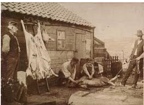
't Vèereke op de leer.