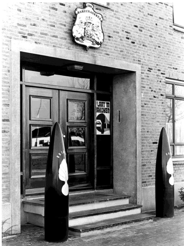
Fig. 1 : De ingang van het brigadegebouw aan de Orgellaan.

In dit boekje wordt de geschiedenis van de marechaussee in Uden vanaf 1818 tot 2006 beschreven.