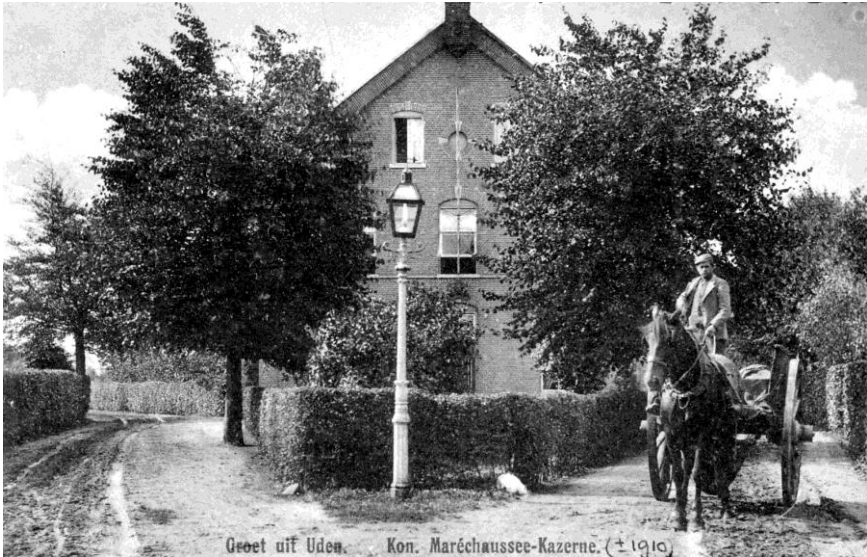
Fig. 5: Het brigadegebouw omstreeks 1910. Het zicht op de toegangsdeur werd belemmerd door enkele struiken. Van wegverharding was nog geen sprake.