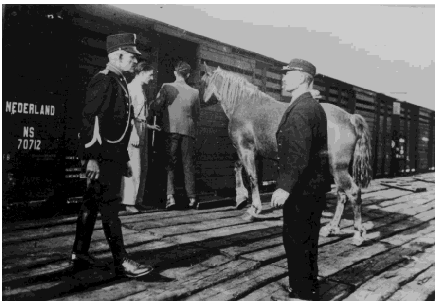
Fig. 9: In het mobilisatiejaar 1939 werden paarden gevorderd voor het Nederlandse leger. Dit gebeurde ook in Uden. De marechaussee hield een oogje in het zeil om direct op te kunnen treden bij eventuele onregelmatigheden.

Door de politieke ontwikkelingen in Europa nam de oorlogsdreiging toe en werd in 1939 de algehele mobilisatie afgekondigd. Ten dienste van het leger werden er motorvoertuigen en paarden gevorderd. Bij het vorderen van onder andere de paarden hielden leden van de brigade toezicht.