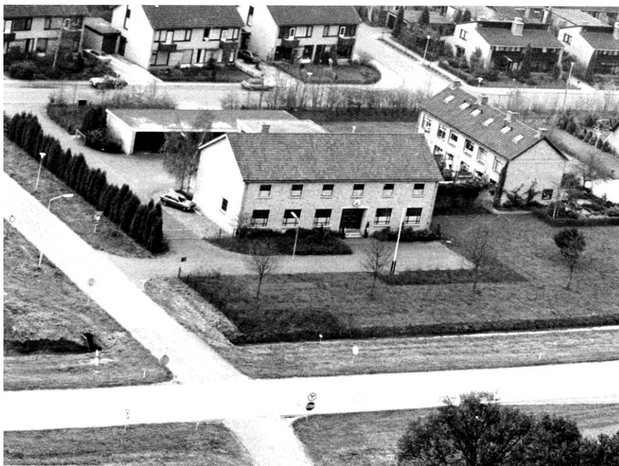
Fig. 15: Het brigadegebouw aan de Orgellaan met rechts de drie dienstwoningen

Als we nu nog marechaussees in Uden zien, dan komen ze van een andere standplaats.