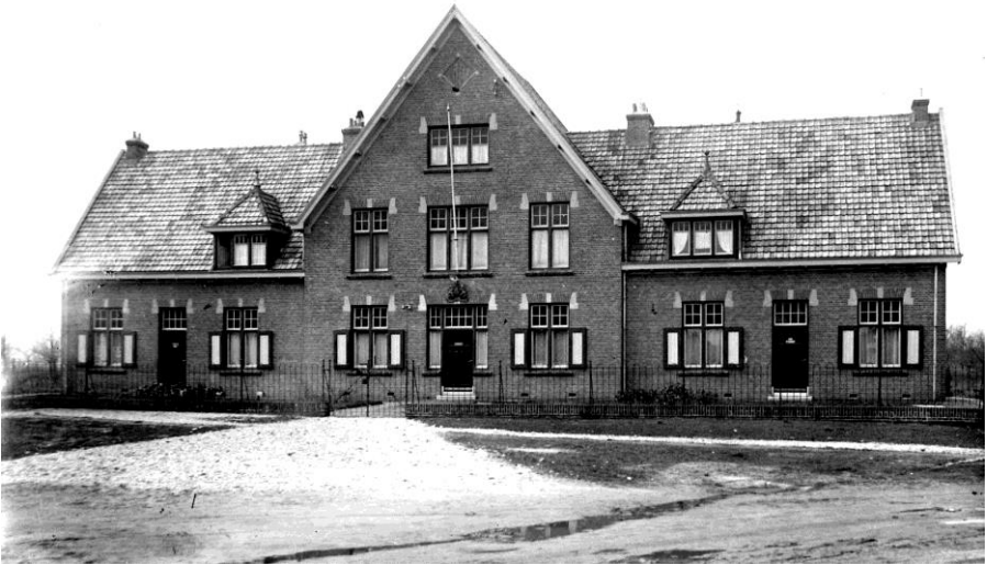
Fig. 7: Het brigadegebouw kort na de voltooiing in 1922. Boven de ingang is het gietijzeren wapenschild van de Koninklijke Marechaussee aangebracht. De brigade was gevestigd in het middengedeelte. Links en rechts bevonden zich de dienstwoningen.

In 1922 werd het oude gebouw verlaten en trok de brigade in het nieuwe gebouw.