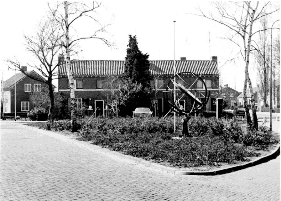
Fig. 4: Op deze plaats aan de Helenastraat werd de nieuwe kazerne gebouwd.

Bij Raadsbesluit van 28 oktober 1898 werd het werk gegund aan Henricus van den Heuvel voor het bedrag van fl.9126,--