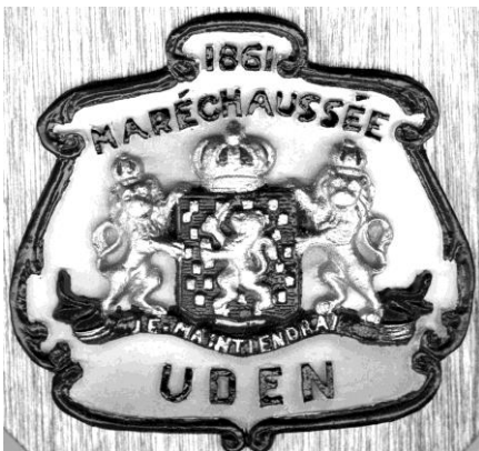
Fig. 3: Replica van het schild van de Udense marechaussee.

Voor het overbrengen der “effecten en furnituren” van Uden naar Veghel droeg H.van Asperen zorg tegen een vergoeding van fl.15,--