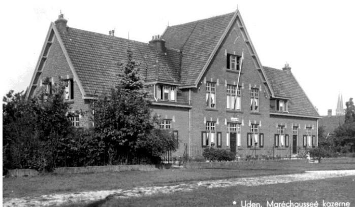
Fig. 11: Deze foto is ook uit 1941. Het wapenschild is vervangen door een houten bord met het opschrift Marechaussee.