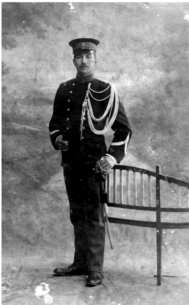
Fig.8: Deze foto van een vooralsnog onbekende marechausee uit Uden dateert van 1928. Het tuniek is “rechts geknoopt”. De eerste helft van de maand moest het links geknoopt worden en de tweede helft rechts. Dit om verkleuring van het tuniek te voorkomen.