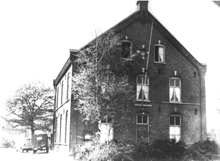
Fig. 13: Foto van Huize de Roos. De dienstauto, een jeep, staat naast het gebouw geparkeerd.

betrokken worden. Dat gebouw, beter bekend als Huize De Roos, werd nu gehuurd van het R.K. Kerkbestuur St. Petrus te Uden. Naast de bovenverdieping had de brigade ook de zolder en twee berghokken in gebruik. Cellen waren niet aanwezig.