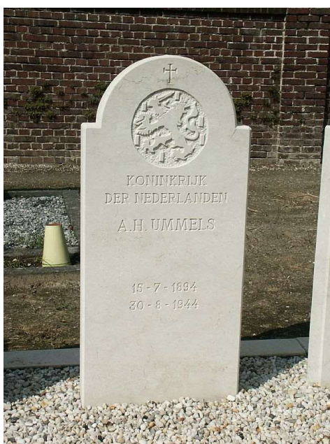
R.K. Begraafplaats te Reuver.

Hij is als oorlogsslachtoffer opgenomen in het Slachtofferregister van de Oorlogsgravenstichting te Den Haag.