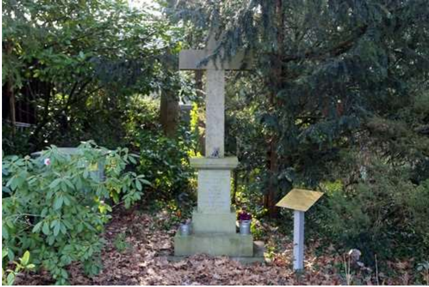
Executie- en Oorlogsmonument, Patersweg te Belfeld.