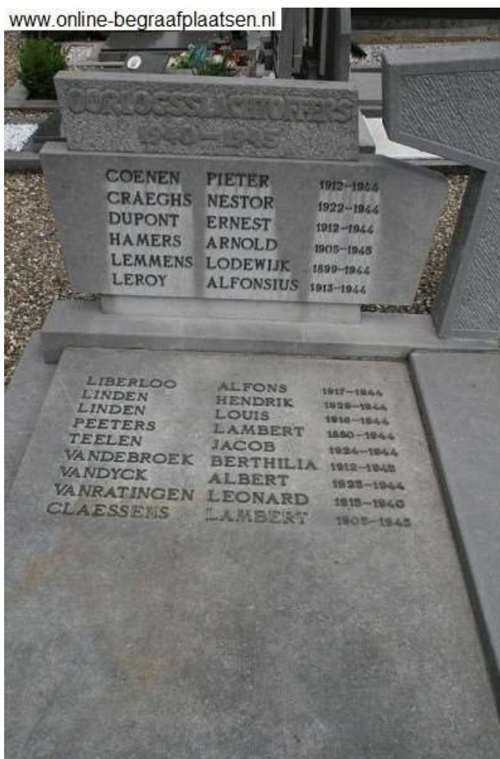
Grafzerk op de begraafplaats te Neeroeteren, België.