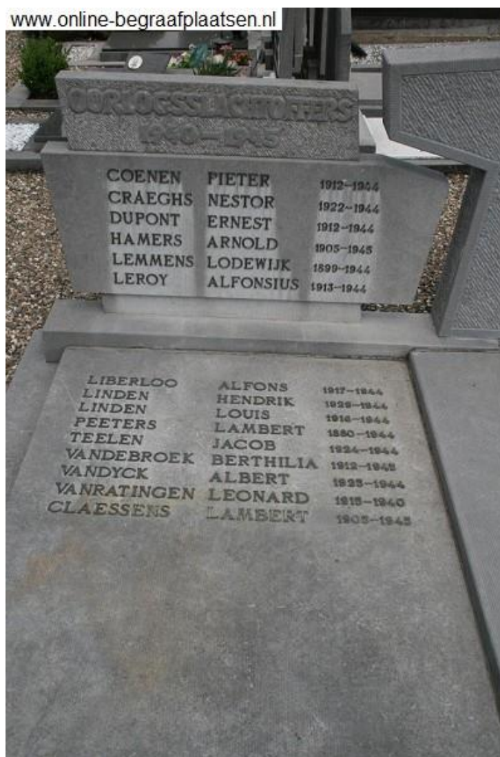
Grafzerk op de begraafplaats te Neeroeteren, België.